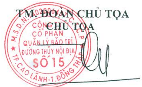
Nguyễn Đình Thi